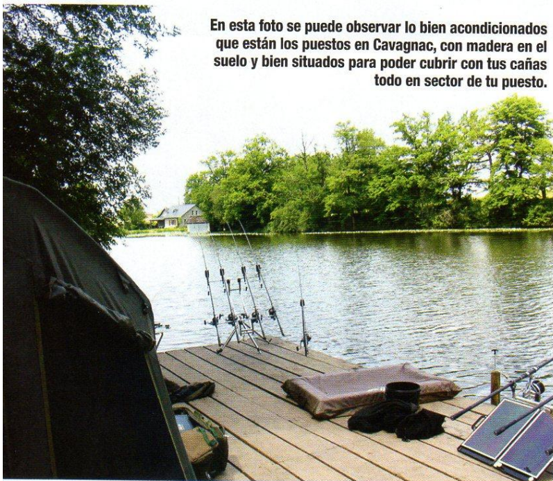
En esta foto se puede observar lo bien acondicionados que están los puestos en Cavnac, con madera en el suelo y bien situados para poder cubrir con tus cañas todo en sector de tu puesto.

El recuento final de peces que tuvimos fue de veintiuna capturas, entre ellas cuatro amures de 9, 11, 19, y 21,5 kilos. En cuanto a carpas conseguimos sacar diecisiete peces, las más grandes de 16, 18, 18,5, 19, 21,5 y 26 kilos, el resto de carpas oscilaba entre 9 y 14 kilos. Con estos resultados, nos podemos hacer una idea respecto al potencial de pesca con el que cuenta este lago. Un paraíso cercano al que sin duda alguna volveremos. ●