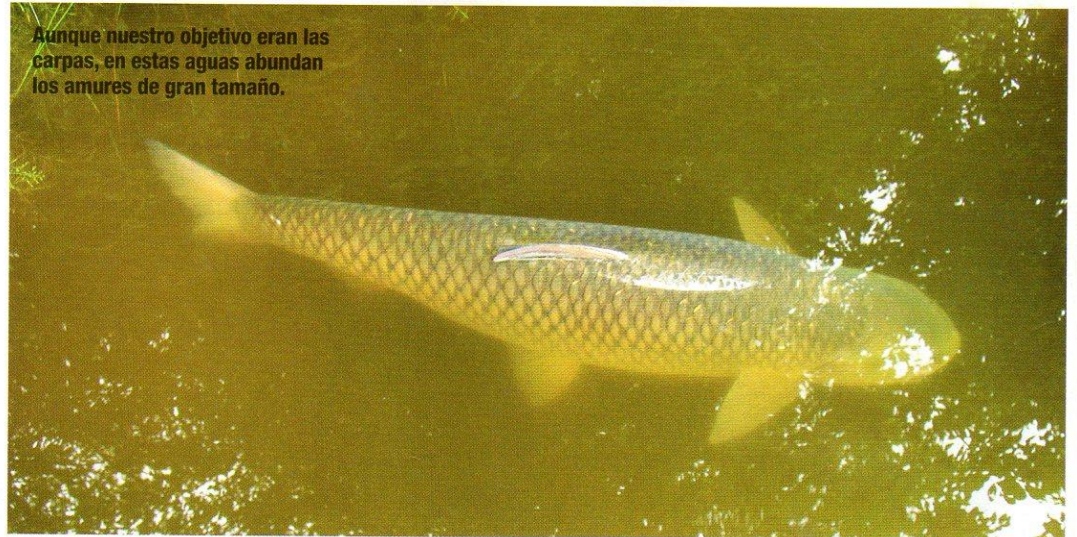
Aunque nuestro objetivo eran las carpas, en estas aguas abundan los amures de gran tamaño.

Decidimos que nada de pellets, ni aceites, ni estimulantes, esto solo lo empeoraría, pusimos todas las cañas con chufas blandas y normales sin ningún tipo de estimulante